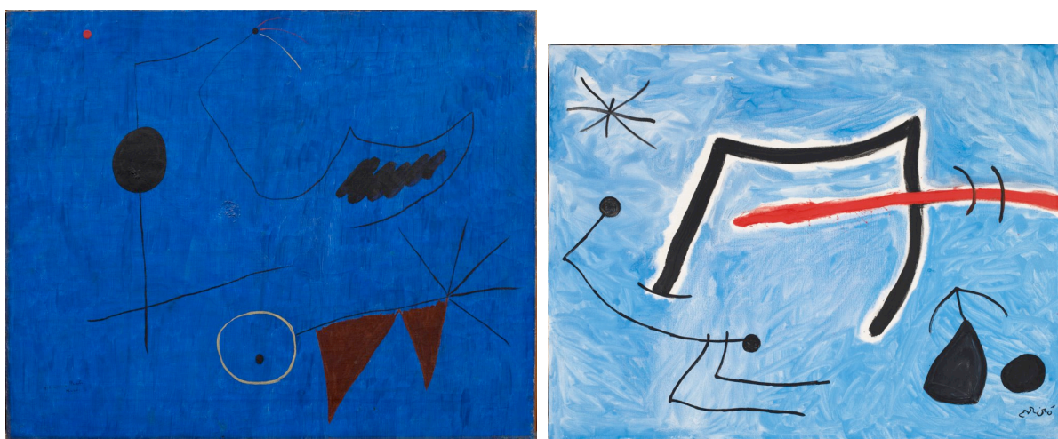
À gauche, Miró, Painting , 1925, huile sur toile, 49 x 60 cm.