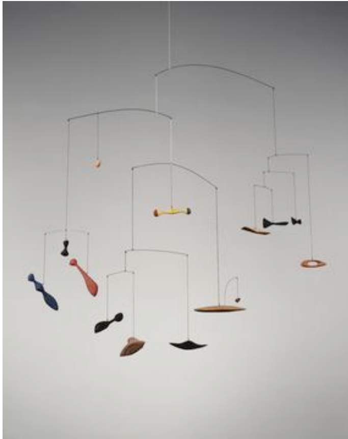
Calder, Constellation mobile , 1943, wood, wire, string and paint.