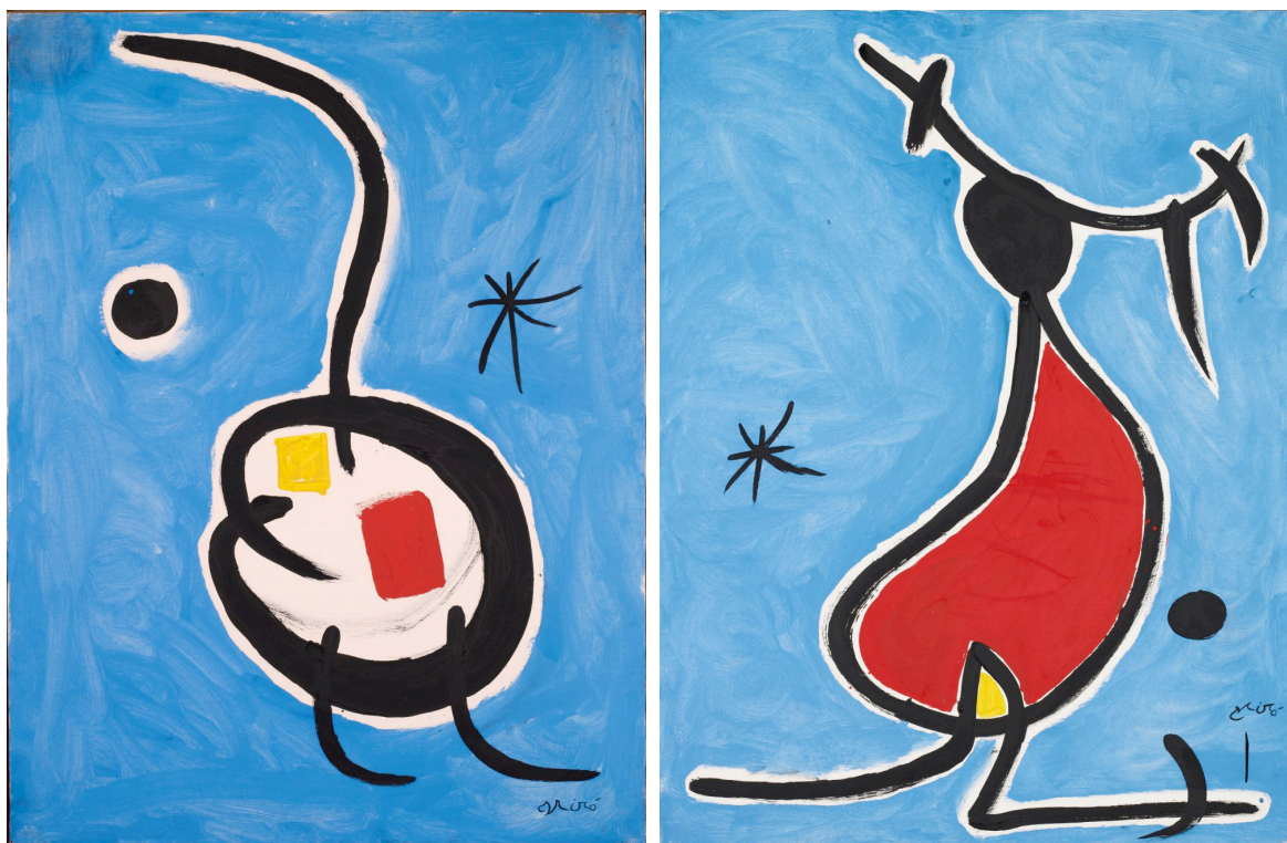
À gauche, Miró, Personnage, étoile , 1978, acrylique sur toile, 116 x 89 cm.