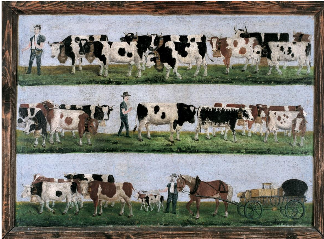
Poya par Joseph Python de Villariaz, vers 1890. Exposée au Musée gruérien.

Les activités proposés dans ce document peuvent être effectuées avant ou après la visite au Musée gruérien. Les exercices se réfèrent aux propositions d'activités mentionnées dans le dossier pédagogique.