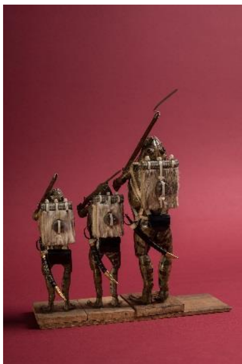
Les trois militaires

La classe se déplace ensuite à l'Atelier de poterie Miss Terre où les élèves pourront créer leurs propres grenouilles en terre cuite. Les œuvres pourront être emportées à la fin de l'activité. Chaque enfant est prié de prendre un récipient à couvercle pour le transport de la grenouille en terre cuite mesurant environ 15 cm x 15 cm et 10 cm de hauteur. Par exemple : boîte de chaussures, récipient alimentaire en plastique, etc.